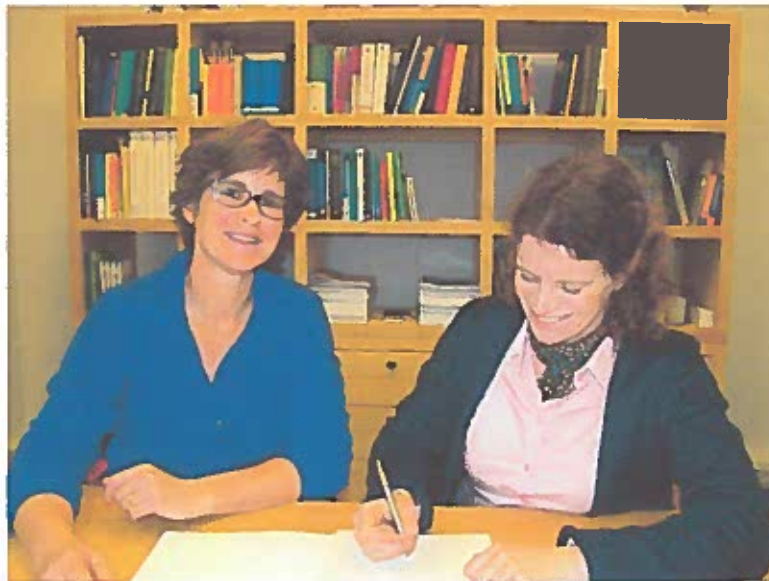
Ondertekening statuten december 2015 door de voorzitter en secretaris